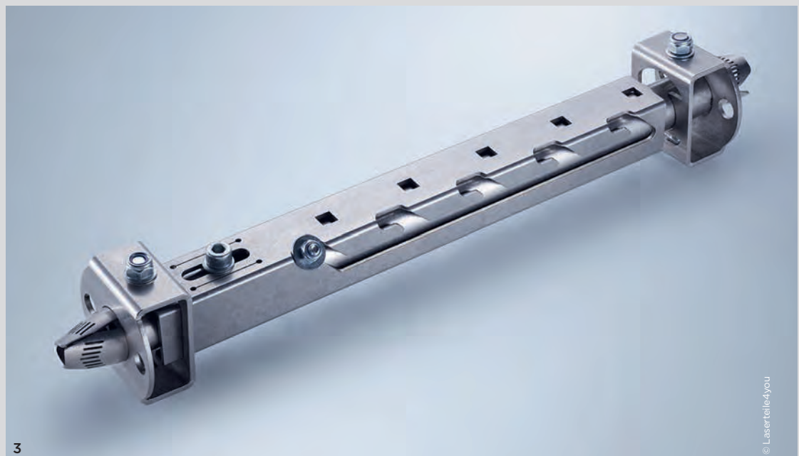
3 Kann ein Anbieter über die Online-Möglichkeiten hinaus konstruktiv und fertigungstechnisch unterstützen, gibt das den Kunden mehr Sicherheit und Vertrauen.

Mit wachsender Anzahl an Online-Bestellplattformen und der steigenden Nutzung verändern sich auch die Nutzer und deren Ansprüche und Wünsche. Aus den anfänglichen Klein-Gewerbetreibenden und Privatpersonen werden zunehmend Industriebetriebe, aus Einzelteilen und Mindermengen immer öfter kleine und mittlere Serien. Und aus einfachen Prozessen und Blechteilen inzwischen komplex bearbeitete Werkstücke und sogar anspruchsvolle Baugruppen. Das Modell ist im B2B-Bereich angekommen und dort nicht mehr wegzudenken.